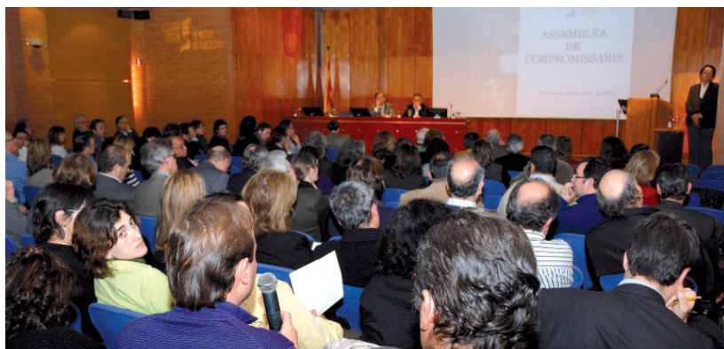
1. Edifici del COMB. 2 i 3. Assemblea de Compromissaris del COMB del període 2010-2014.

Els ingressos totals han pujat a 13.604.575 euros, que s'agrupen en tres grans capítols: les quotes, que s'han mantingut sense variació respecte a l'exercici precedent amb bonificacions del 50% per als metges joves i que han representat un import final de 6.562.561 euros, evolucionant sensiblement per sobre del pressupost amb una desviació positiva del 2,56%, com a conseqüència d'un lleuger augment del nombre de nous metges col·legiats sobre la previsió inicial, amb un creixement del nombre de col·legiats de l'1%; les quotes al fons social, amb >