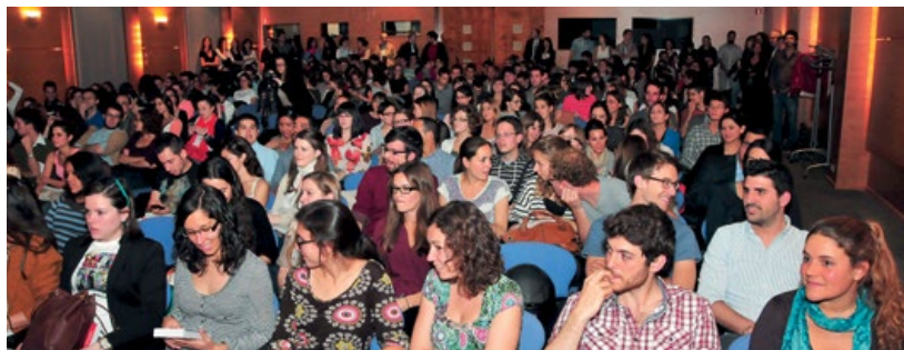
La situació professional dels metges que finalitzen el programa MIR 2006-2011-2012-2013