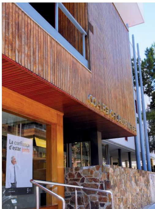
Edifici del COMB.

Finalment, cal mencionar també com a dada molt positiva que l'any passat es van resoldre 128 assumptes penals que estaven en curs, dels quals el 86% van ser arxius i sentències absolutòries. Les absolucions representen en via civil un 39% del total i superen, per segon any consecutiu, les sentències condemnatòries. ■